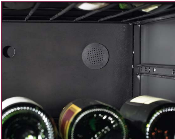
Filtre au charbon actif